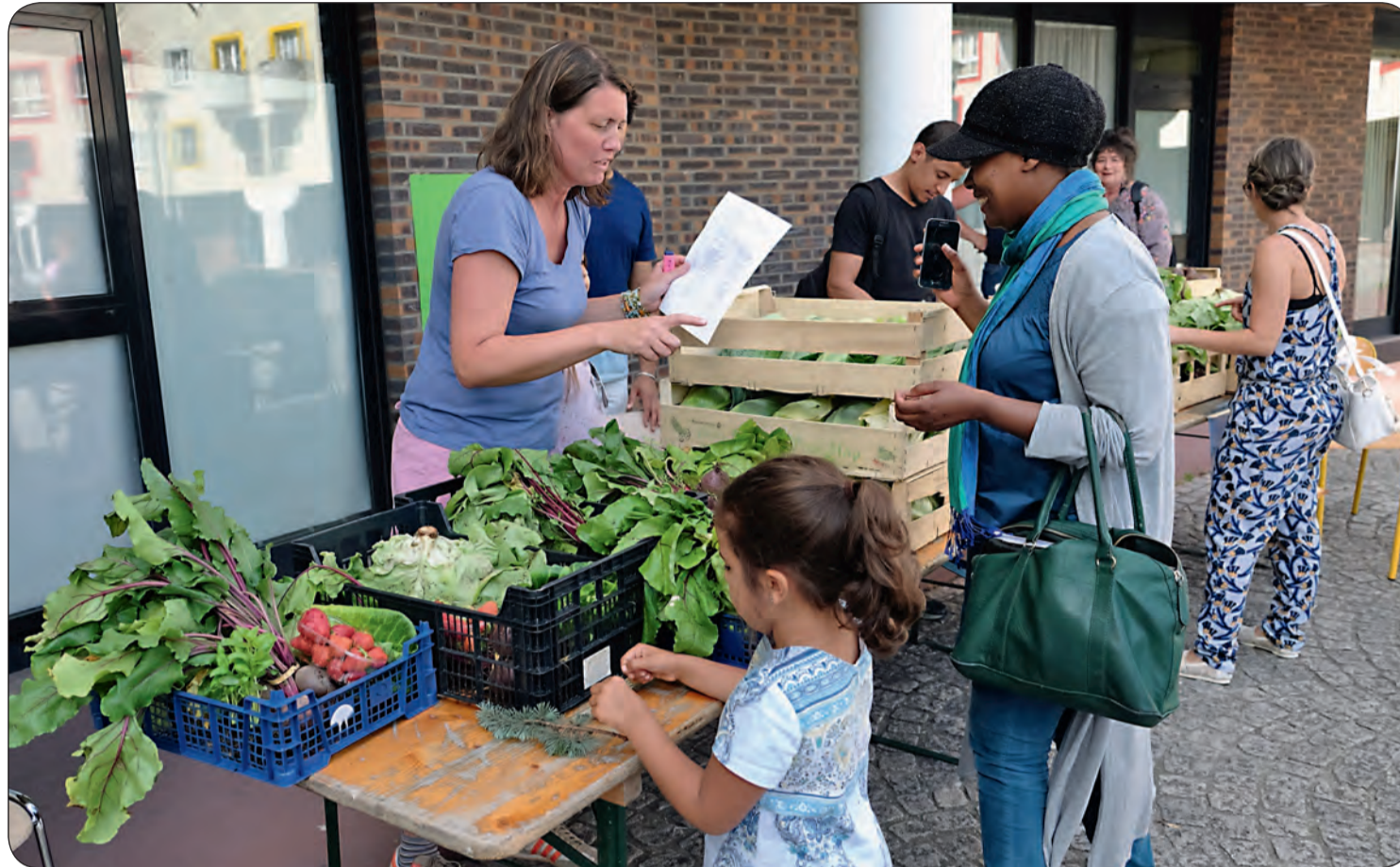
Le prix du panier hebdomadaire est fixé à 11 euros et restera stable. Seul le poids du panier pourra changer en fonction du prix des produits.

Consommer autrement, bio, directement de l'agriculteur au consommateur, avec une maîtrise du coût : c'est le challenge lancé par Villet'Amap aux Villetaneusiens.